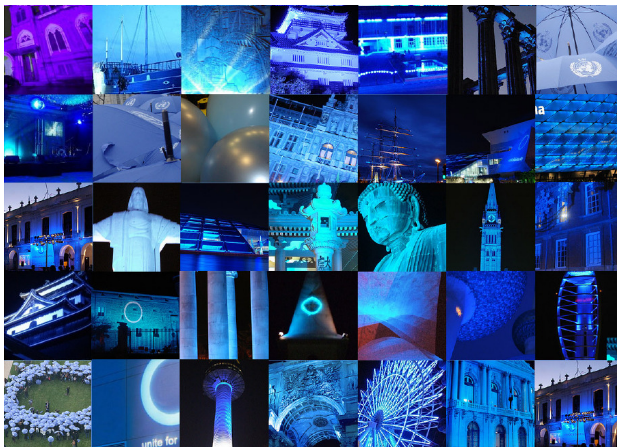
Foto-Collage aus Bildern von Gebäuden, Denkmälern und Wahrzeichen, die zum Weltdiabetestag 2007 in Blau erstrahlten